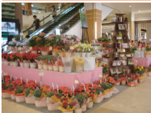
1Fエスカレーター前