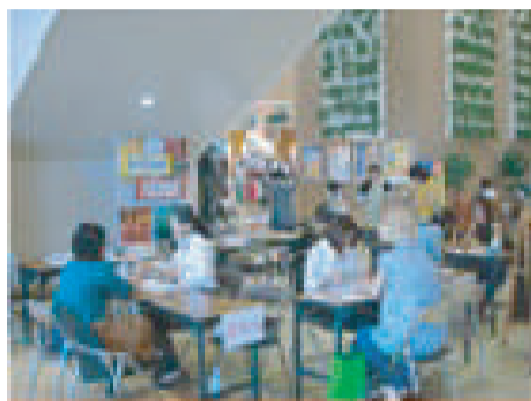
1Fエスカレーター下