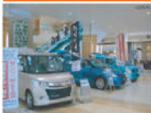
1Fエスカレーター前