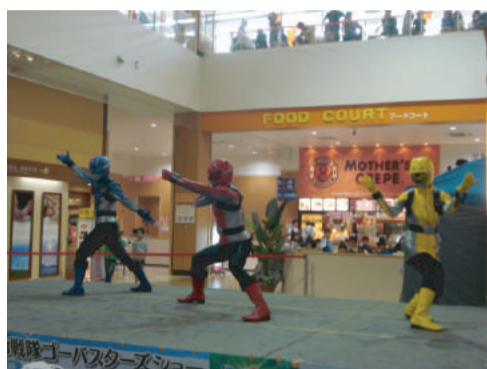
1F中央イベント広場

オプシアミスミでは、販売・展示会・発表会などを実施されたい団体様へ、イベントスペースの貸し出しを行っております。