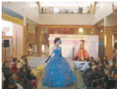
1F中央イベント広場